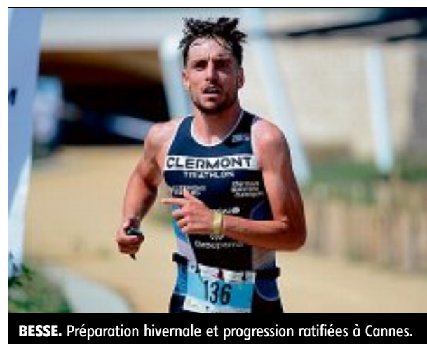
BESSE. Préparation hivernale et progression ratifiées à Cannes.

Des tests très satisfaisants sur les trois disciplines à désormais valider en compétition. En l'occurrence au triathlon de Montélimar, le 17 avril, épreuve où se jouera la sélection pour les championnats d'Europe prévus à Olsztyn (Pologne), le 26 mai prochain.